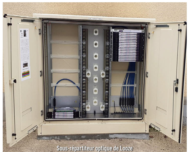
Sous-répartiteur optique de Looze

Interrogé, Monsieur Laurent Chat , maire de cette commune rurale, a répondu : « Enfin, le rural n'est plus délaissé en accédant aujourd'hui aux mêmes technologies que les zones urbaines. C'est un vrai succès, en particulier pour les habitants obligés de travailler ou d'étudier à distance. »